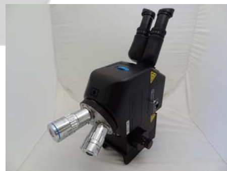
Высокоточные микроскопы Seiya

Для элементов размером от 5 микрон и больше мы предлагаем доступные по цене 3-осевые микропозиционеры с разрешением 0,025" на оборот. Данные устройства обладают доступным перемещением 0,300" в осях X, Y и Z. Для элементов размером менее 5 микрон мы предлагаем специальные микропозиционирования с доступным перемещением 0,500" в осях X, Y и Z. Данные устройства представлены в 3 вариантах разрешения от 0,025" 0,010" на оборот. Каждый из них может быть укомплектован магнитной (слева) или вакуумной (справа) базой.